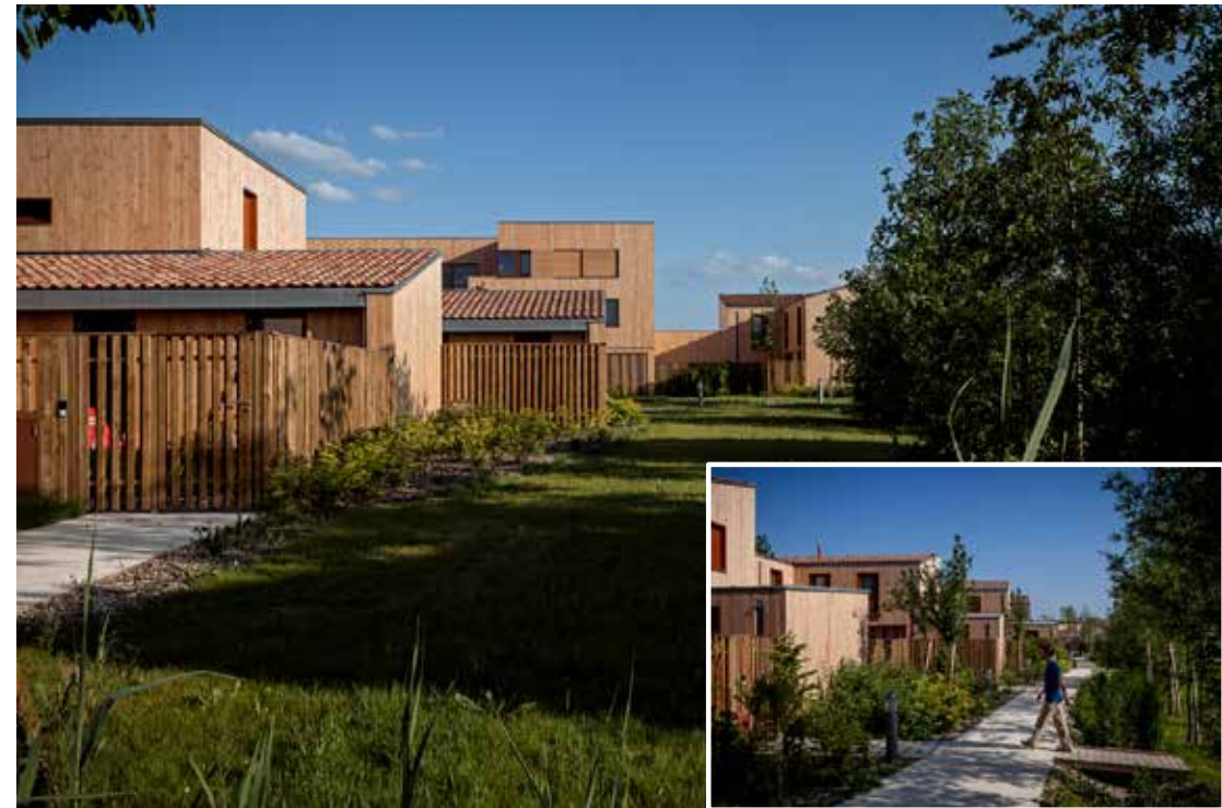
Locatifs sociaux - Chanteloup-en-Brie (77)