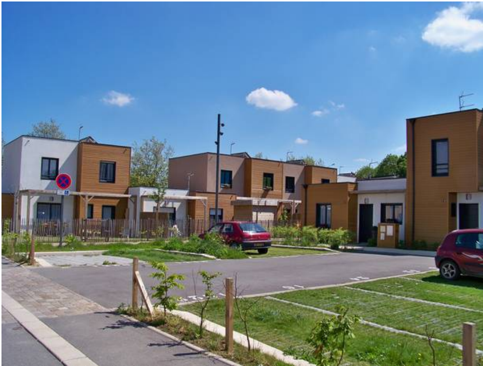
Aménagement autour d'une courée - Le Raquet - Douai (59)