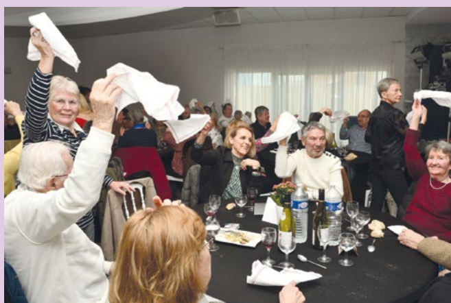
6 - 9 février Repas offert par la Ville aux seniors de 65 ans et +