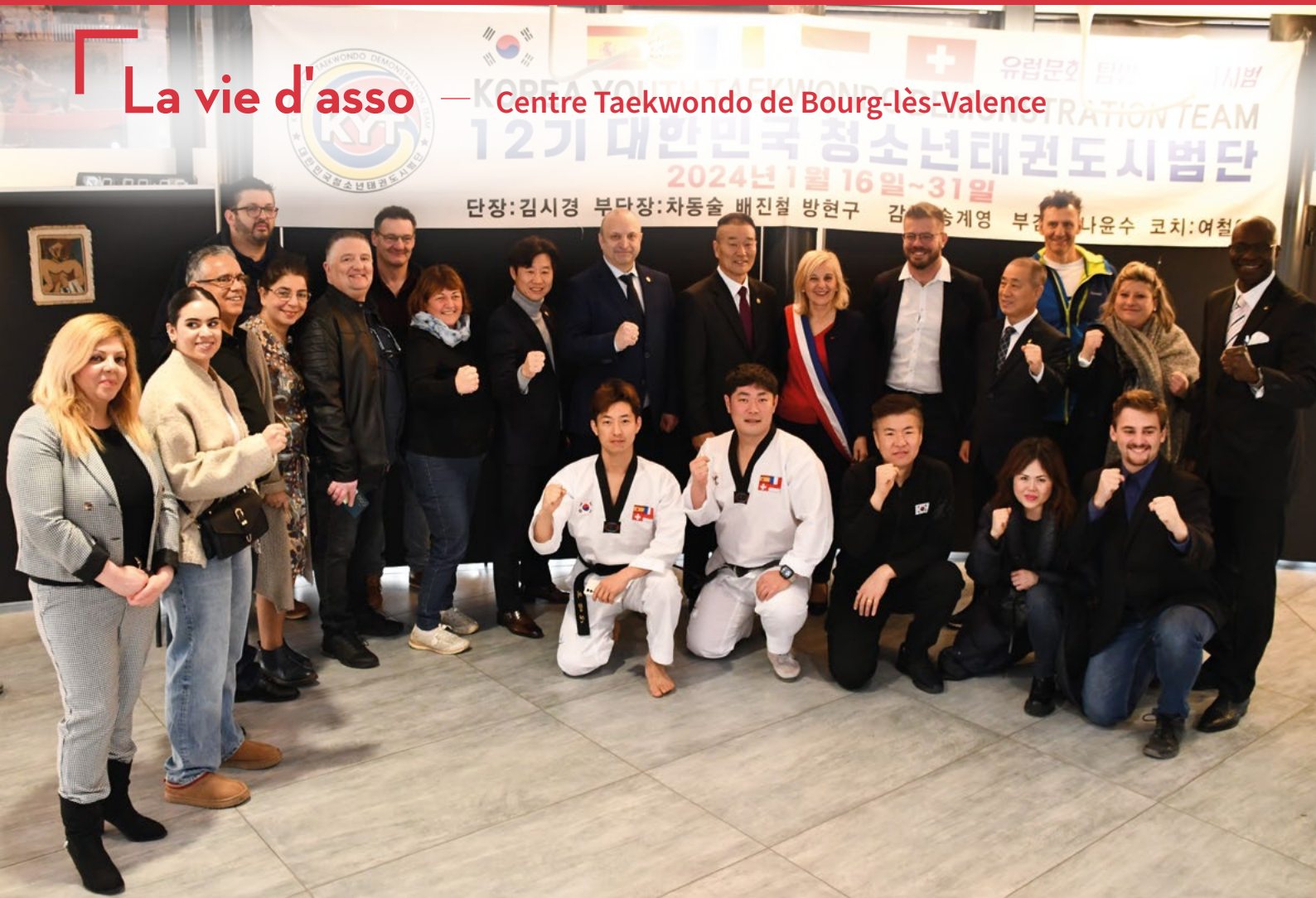
Les élus municipaux et les responsables du club de taekwondo de Bourg-lès-Valence entourant les membres de la délégation olympique coréenne accueillie en janvier dernier