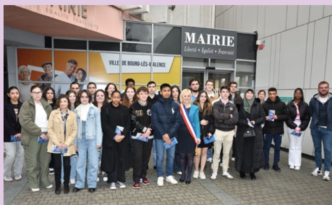
9 mars Cérémonie citoyenne Remise des cartes électorales aux jeunes électeurs