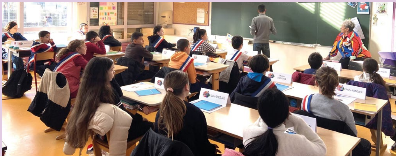
3 février Première commission du Conseil municipal des jeunes