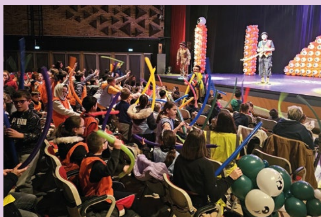
23 - 24 février Festival pour enfants