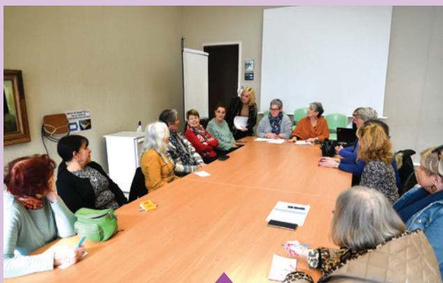
12 février – Rencontre des Dames de coeur Vous souhaitez devenir bénévole Dame de coeur pour égayer le quotidien des personnes âgées isolées ? Contactez le CCAS : 04 75 79 45 78