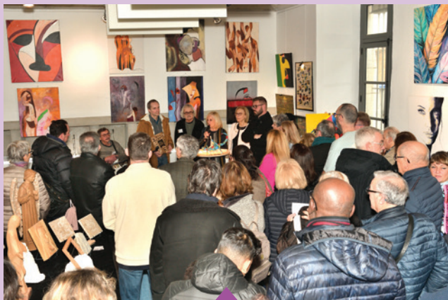
1er et 2 février – Exposition Lez'Arts Bourcains à la Cartoucherie