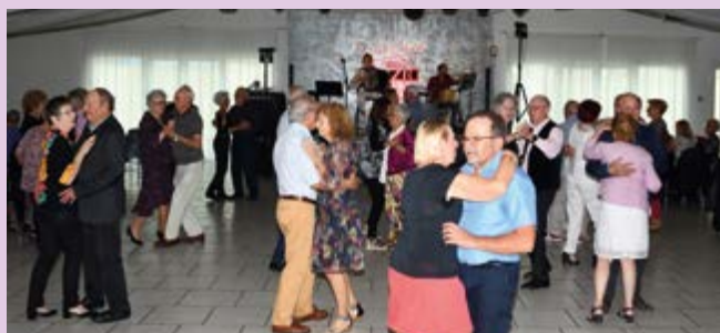
17 octobre – Thé dansant pour les seniors de 60 ans et plus organisé par le CCAS