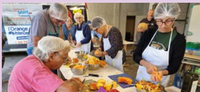
9 octobre – Atelier de fabrication de soupe de courges à partir des surplus du Jardin du Colombier