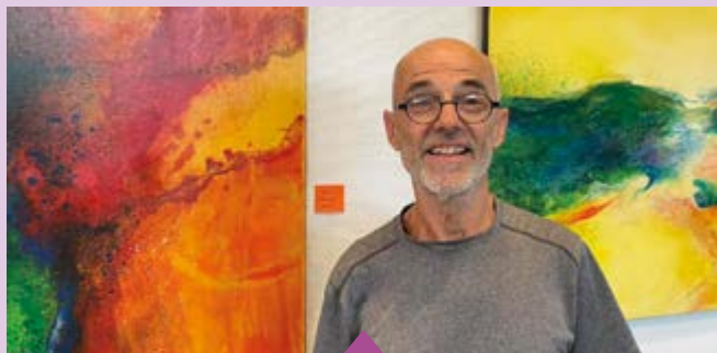
Du 2 au 20 octobre – Exposition des peintures de Guy Lanchais en salle des mariages