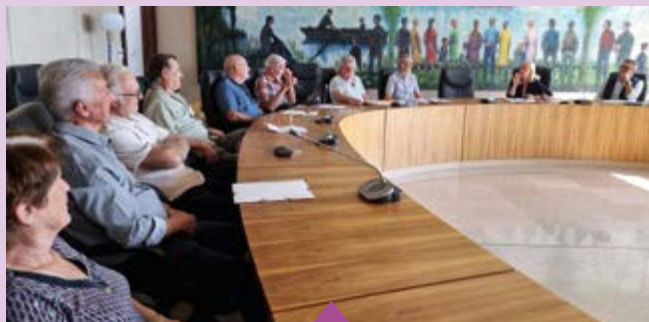
3 octobre – Réunion avec les référents Citoyens vigilants