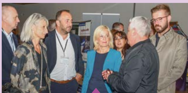
24 octobre – 7 e Rencontre régionale de la sécurité territoriale