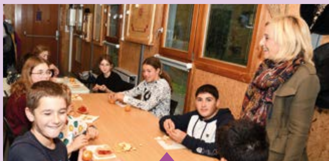
23 octobre – Goûter avec les adolescents du centre de loisirs Louis Jourdan