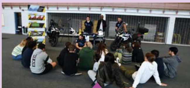
12 octobre – Sensibilisation à la sécurité routière des élèves du lycée des 3 sources par la police municipale