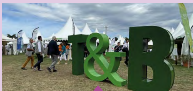
20 et 21 septembre 9e édition du salon Tech & Bio