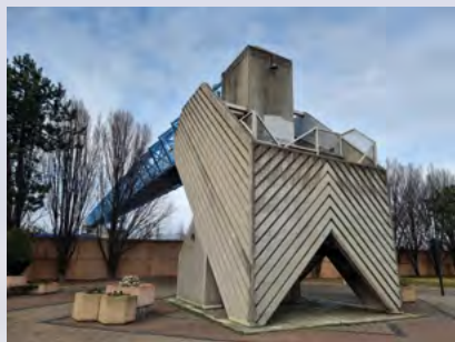
L'ancienne passerelle avant l'aménagement du site