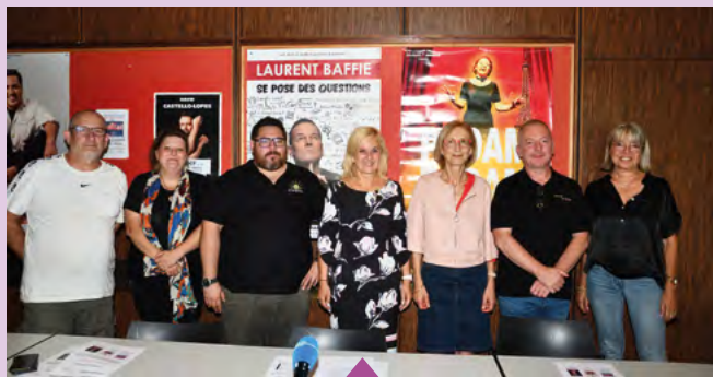
13 septembre - Théâtre le Rhône présentation de la saison 2023-2024