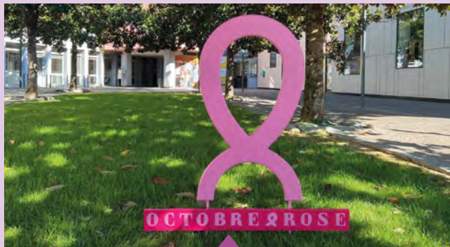
Octobre rose - Bourg-lès-Valence soutient la lutte contre le cancer du sein