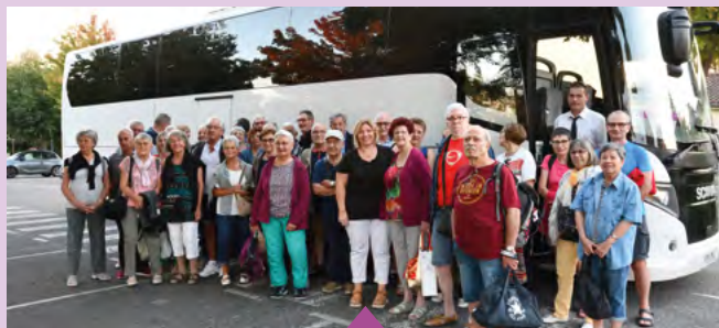
Du 9 au 16 septembre Voyage des seniors dans le Cantal organisé par le CCAS