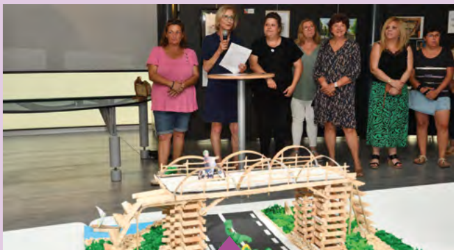
Du 11 au 15 septembre Exposition d'artistes sur le thème de la passerelle