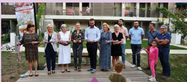
19 septembre - Inauguration de la résidence "Les Artistes" de Drôme Aménagement Habitat