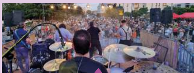
17 juin Festival MusiKàBourg