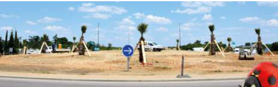
Une palmeraie pour valoriser l'entrée de Bourg-lès-Valence