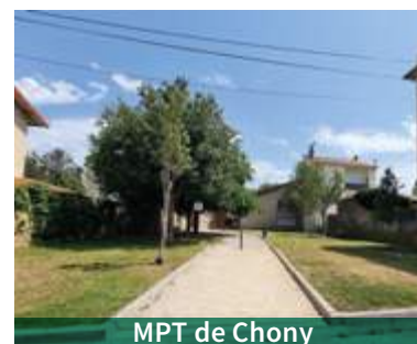
MPT de Chony

Privilégier l'engazonnement et réduire la minéralité pour créer des îlots de fraîcheurs :