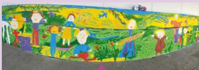
Juin Réalisation d'une fresque à l'école maternelle Germain Fraise