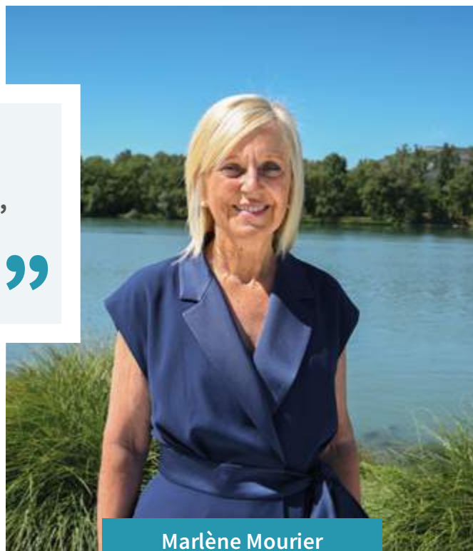
Marlène Mourier Maire de Bourg-lès-Valence

“ Adapter la gestion des espaces verts à la réalité du changement climatique, tout en proposant un cadre de vie toujours plus agréable aux habitants ”