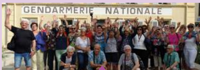
17-24 juin Voyage des seniors sur la Côte-d'Azur organisé par le CCAS