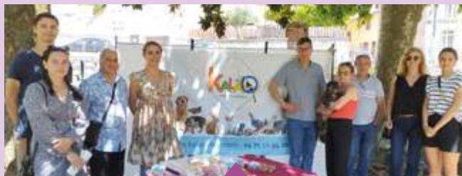
3 et 24 juin Séances de conseils en nutrition pour chiens et chats