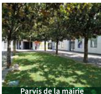
Parvis de la mairie

Privilégier l'engazonnement et réduire la minéralité pour créer des îlots de fraîcheurs :