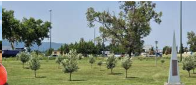
L'oliveraie du Jardin des hirondelles