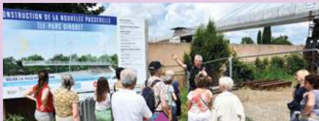
10 et 11 mai Visites du chantier de la passerelle et du belvédère