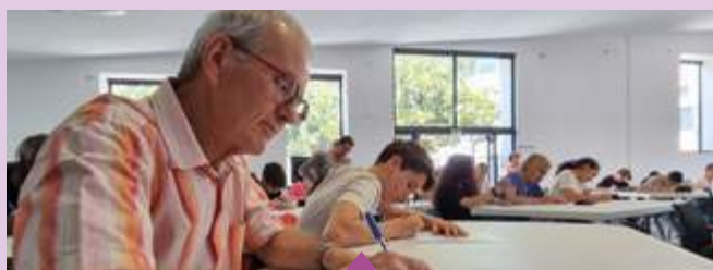
13 juin Dictée intergénérationnelle