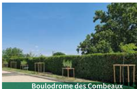
Boulodrome des Combeaux