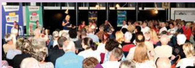
12 juin Réunion publique d'informations sur la Maison du Pouvoir d'Achat