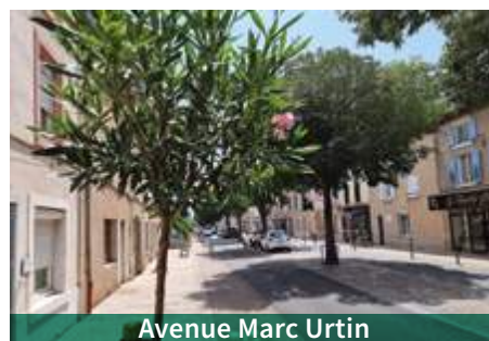
Avenue Marc Urtin