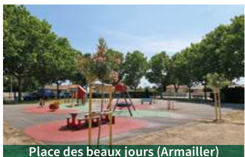
Place des beaux jours (Armailler)