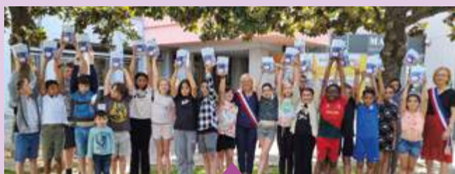
14 et 21 juin Remise de dictionnaires aux élèves de CM2