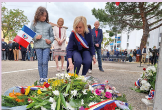
8 mai 78 e anniversaire de la Victoire de 1945