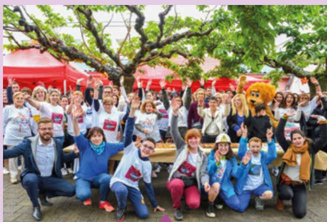
13 mai 1 400 visiteurs pour les 20 ans de la Fête du jeu