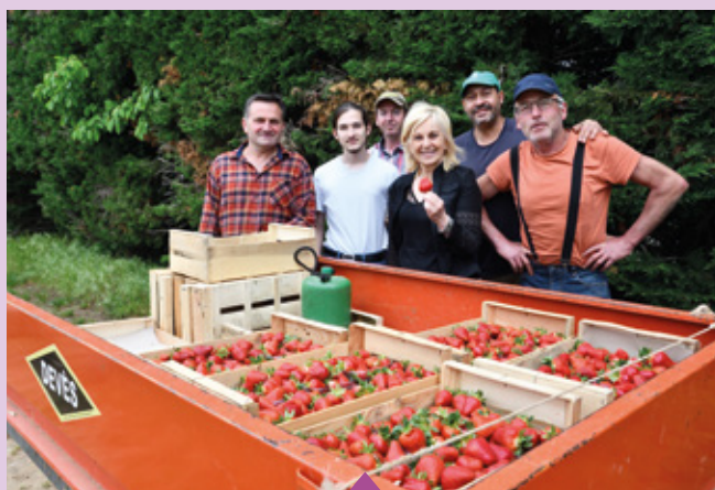
11 mai Visite de l'exploitation agricole Vial Fruits