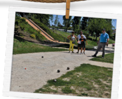
Tournoi de pétanque