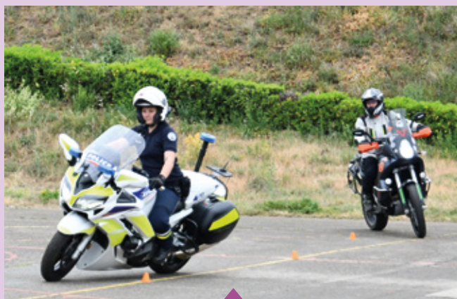
7 mai Journée "Trajectoire de sécurité" organisée par la police municipale à destination des motards