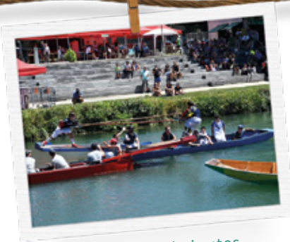
Épreuves de joutes