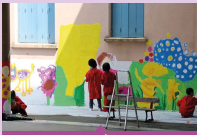
Mai Réalisation d'une fresque par les élèves de l'école maternelle Barthelon