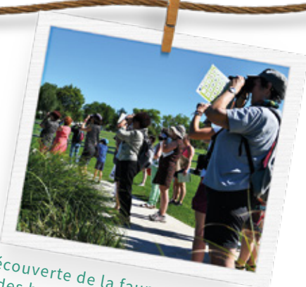
Découverte de la faune et de la flore des bords du Rhône avec la LPO

Depuis la découverte de la faune et de la flore des bords du Rhône avec la Ligue de la Protection des Oiseaux jusqu'au repas karaoké en passant par le tournoi de pétanque en doublette, le marché artisanal, les balades sur le Rhône ou la démonstration de modèles réduits de bateaux... De nombreuses activités se dérouleront au Bassin des joutes tout au long des journées de samedi et de dimanche. Sans oublier la fête foraine, présente durant les quatre jours place des Rencontres et devant la mairie.