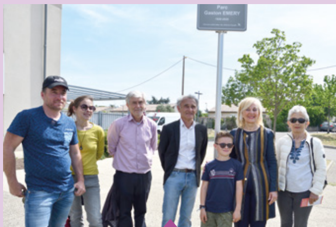
6 Mai Inauguration du parc Gaston Emery