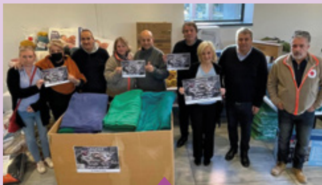
14 février Mobilisation pour les sinistrés du tremblement de terre en Syrie et en Turquie