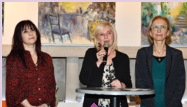
4-5 février 2 500 visiteurs à l'exposition Lez'Arts Bourcains à la Cartoucherie