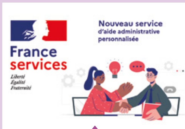
1 er février Ouverture d'un espace France Services à la médiathèque La Passerelle