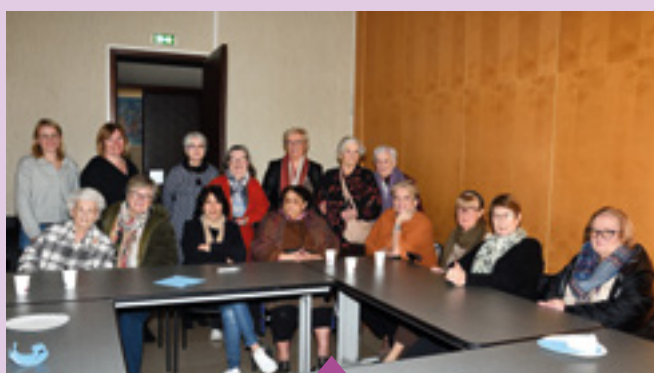
15 février Goûter des Dames de cœur partagé avec leur senior