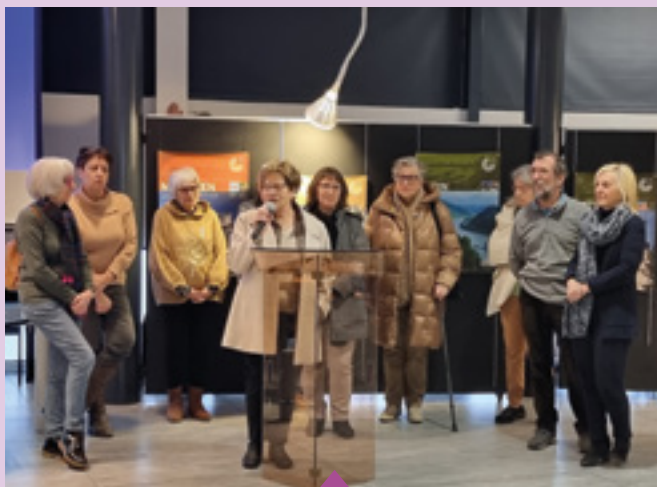
23-27 janvier Semaine franco-allemande