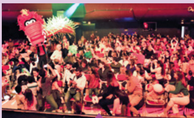
18-19 février Festival pour enfants au Théâtre le Rhône