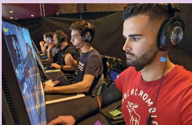
24-30 octobre Semaine du Jeu Vidéo