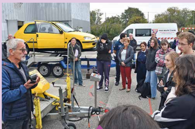
13 octobre Journée de sensibilisation sur les risques routiers organisée par la police municipale, en partenariat avec la Sécurité routière, la police nationale et la Ligue contre la violence routière