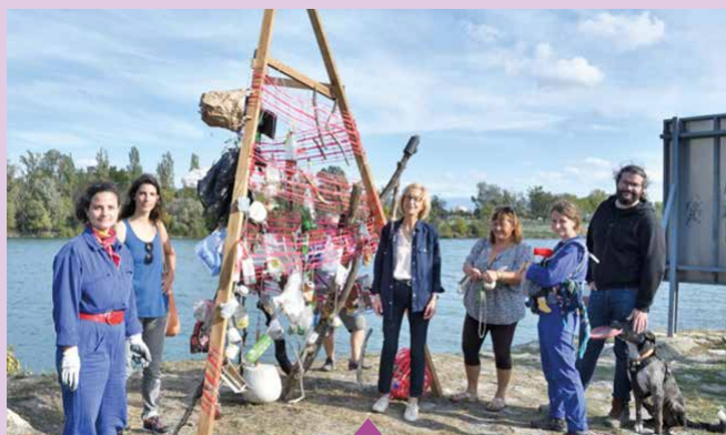
Du 5 octobre au 15 novembre L'observatoire des eaux rusées par le Collectif Toporama