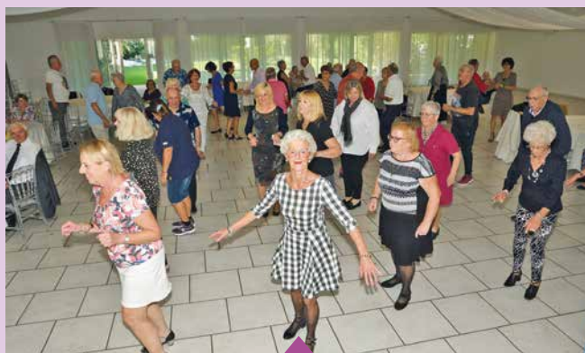
18 octobre Thé dansant organisé par la Ville pour les seniors de 60 ans et plus