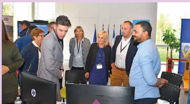
25 octobre 1 er Salon de la sécurité territoriale, en présence de Renaud Pfeffer, Vice-Président délégué à la sécurité de la Région Auvergne-Rhône-Alpes