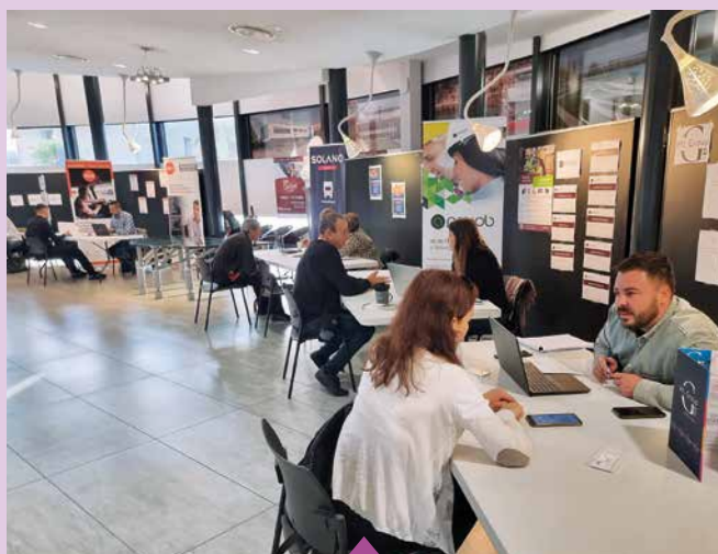
11 octobre 10 e Job dating en mairie avec les agences d'intérim de Bourg-lès-Valence