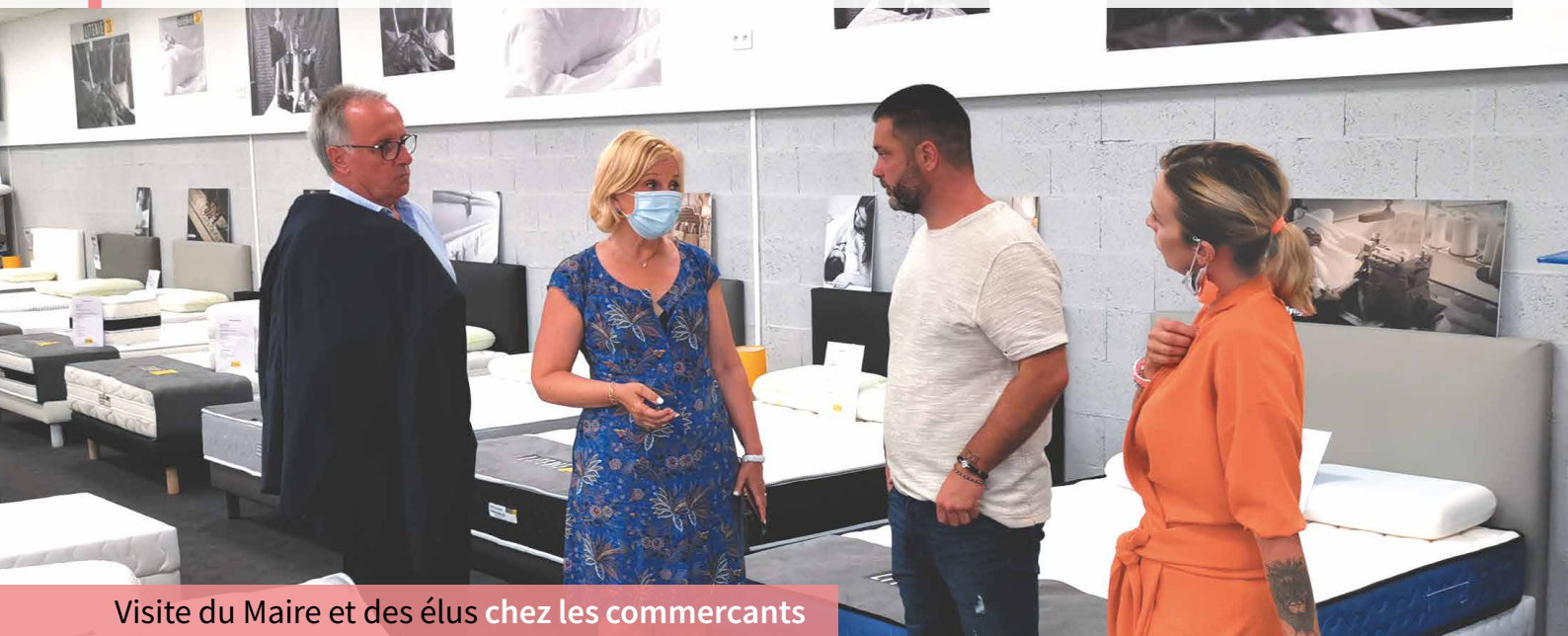
Visite du Maire et des élus chez les commerçants