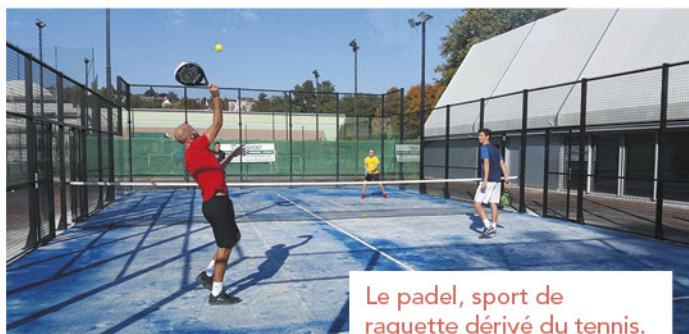
Le padel, sport de raquette dérivé du tennis.

Situés au tennis club, quatre courts de padel verront le jour durant les vacances d'été.