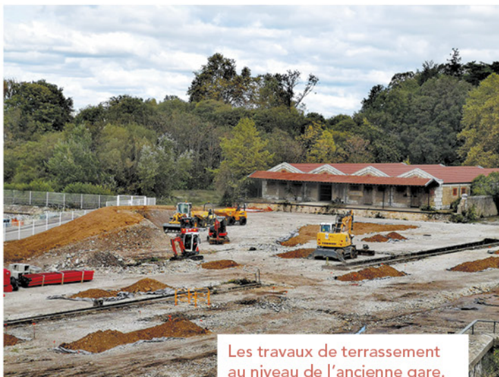
Les travaux de terrassement au niveau de l'ancienne gare.

Ce grand projet, porté conjointement par la communauté d'agglomération Valence-Romans Agglo et par notre Ville, va renforcer l'attractivité du Pôle de l'image animée. Ce parc urbain et paysager de 2,4 hectares ouvert à tous et situé en plein cœur de ville, participera au développement économique, environnemental, culturel et touristique de Bourg-lès-Valence. Il offrira des espaces ludiques tout en valorisant les traces du passé.