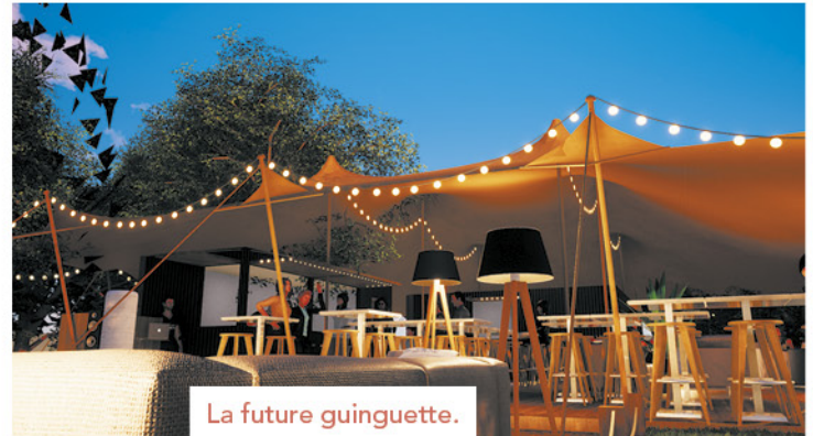
La future guinguette.

Les futurs gérants vous feront bientôt découvrir leur concept « lounge » avec comme horaires d'ouverture de 11h à 21h la semaine avec un service de restauration tous les midis, un service « bar limonade » et des afterworks jusqu'à 21h. Du jeudi au samedi, la guinguette sera ouverte jusqu'à 2h du matin avec