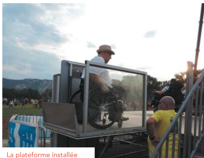
La plateforme installée lors de l'inauguration de l'île-parc Girodet.