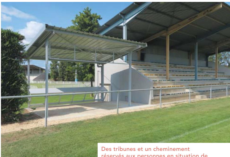
Des tribunes et un cheminement réservés aux personnes en situation de handicap ont été installés au complexe Joseph-Claret (rugby et football).

Depuis sa mise en place, chaque année, de nouveaux chantiers sont donc réalisés. Pour 2019 : réhabilitation des vestiaires du tennis club, création de cheminements et d'abris pour personnes en situation de handicap au stade Joseph-Claret, élévateur pour l'accès aux tribunes et réaménagement des vestiaires de la halle des sports. Enfin, en partenariat avec Valence-Romans Déplacement la commune a également participé à l'élaboration et à la création de 25 quais bus adaptés aux personnes en situation de handicap, aux seniors, aux femmes enceintes et aux parents avec poussettes. Toutes ces actions permettent d'accompagner et d'améliorer leur quotidien.