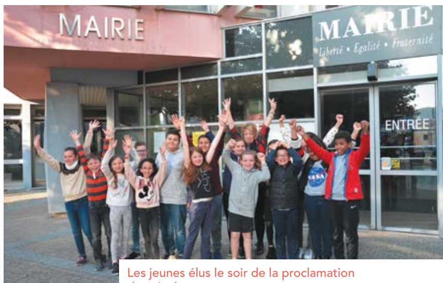
Les jeunes élus le soir de la proclamation des résultats.

Pour les deux ans à venir, chaque conseiller doit s'inscrire dans l'une des deux commissions : « sport, loisirs, culture » ou « cadre de vie, environnement et solidarité ». Une prochaine réunion leur permettra d'exprimer leur choix et de s'investir dans le domaine qui leur tient le plus à cœur.