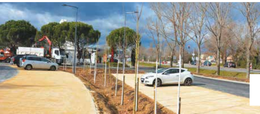
Mi-février, le parking du toueur, situé derrière le théâtre Le Rhône, a été mis en service.