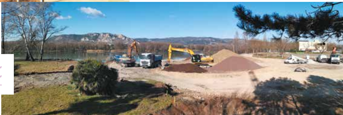
Mi-mars, le parvis, devant le théâtre, prend forme.