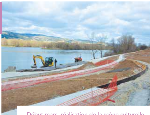
Début mars, réalisation de la scène culturelle au bord du Rhône et matérialisation des cheminements de l'amphithéâtre de verdure.

Le chantier s'étend désormais jusqu'au bassin des joutes.