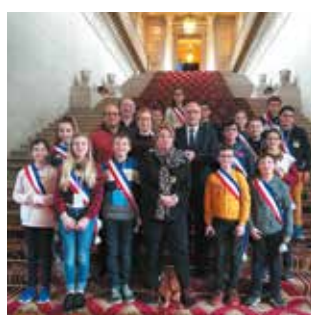
Les enfants du CMJ dans l'escalier d'honneur du Sénat