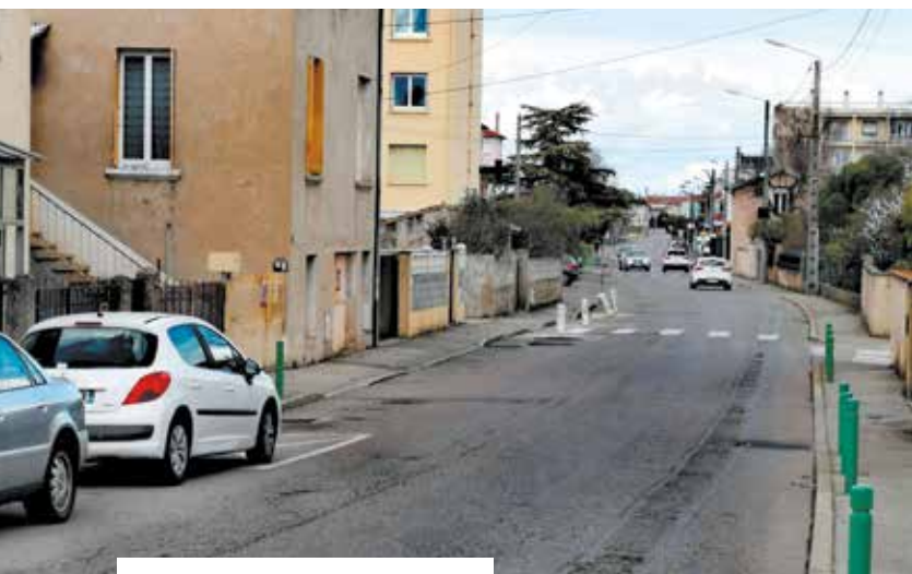
La rue Jean-Bart

Cette année, la municipalité s'engage dans un plan de travaux de voirie conséquent.