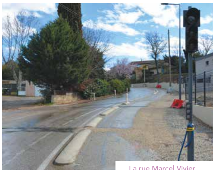
La rue Marcel Vivier

Après l'implantation des nouveaux feux tricolores, l'enfouissement du réseau électrique, la suppression des branchements plomb pour l'eau potable et la création du réseau d'éclairage public, l'aménagement d'un cheminement doux réservé aux cycles et aux piétons, la rue Marcel-Vivier sera fermée à la circulation pendant les vacances scolaires d'avril pour permettre la réfection complète de la voirie et de la piste cyclable.