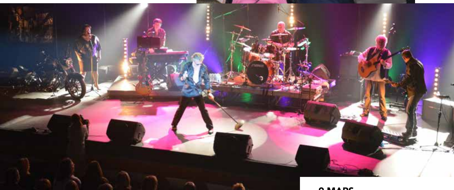
9 MARS Le théâtre Le Rhône a affiché complet pour rendre hommage à l'idole des jeunes, Johnny Hallyday