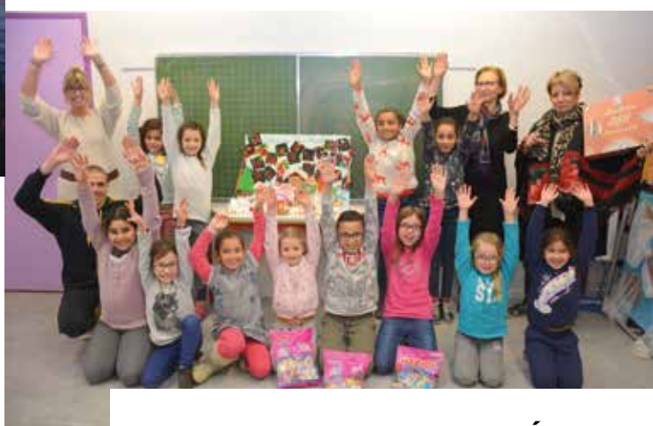
FÉVRIER Félicitations aux écoles de l'Armailler, Chony, Barthelon et Germain Fraisse, lauréates du concours Ici et ailleurs