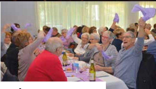
DU 27 FÉVRIER AU 2 MARS Ambiance festive assurée lors des repas offerts aux seniors