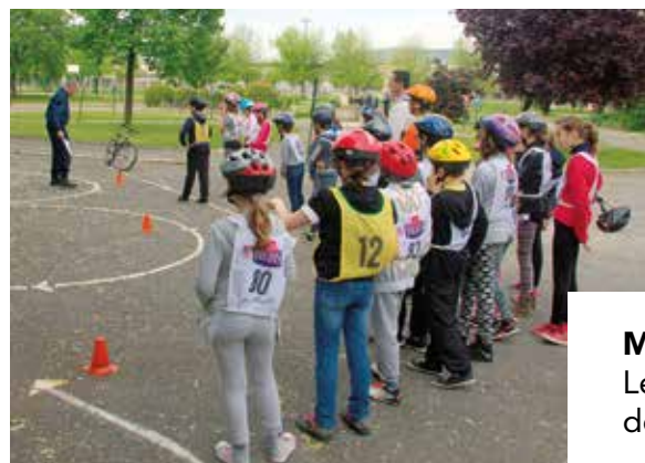
MARS Les écoliers bourcains sur le circuit de la sécurité routière