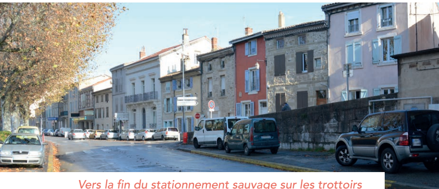
Vers la fin du stationnement sauvage sur les trottoirs

Dans sa volonté de remédier au stationnement anarchique, la Ville travaille actuellement à une réorganisation plus conforme et adaptée.