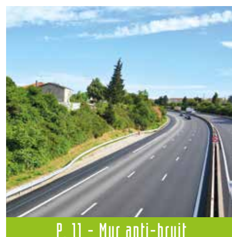
P. 11 - Mur anti-bruit