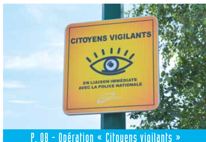
P. 08 - Opération « Citoyens vigilants »