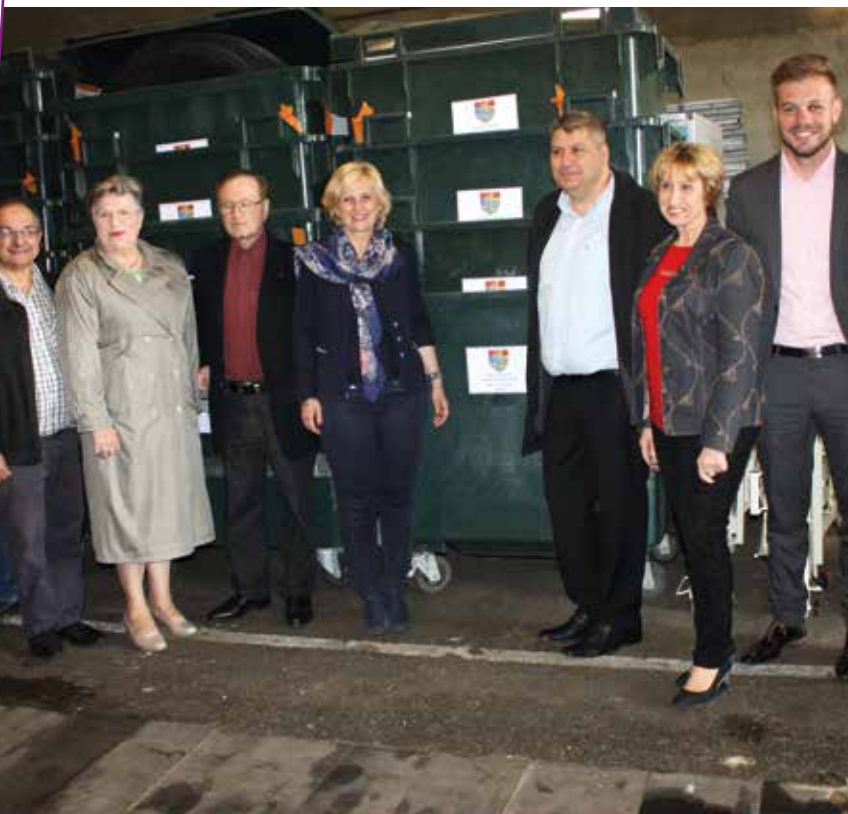
Avec les membres du Comité de jumelage, avant le départ pour Talin