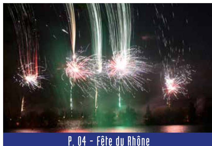
P. 04 - Fête du Rhône

en savoir plus sur www.bourg-les-valence.fr