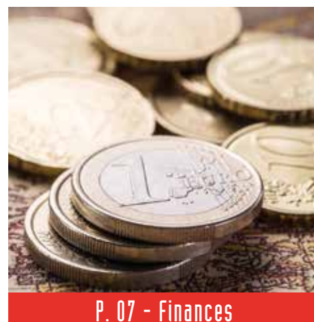
P. 07 - Finances