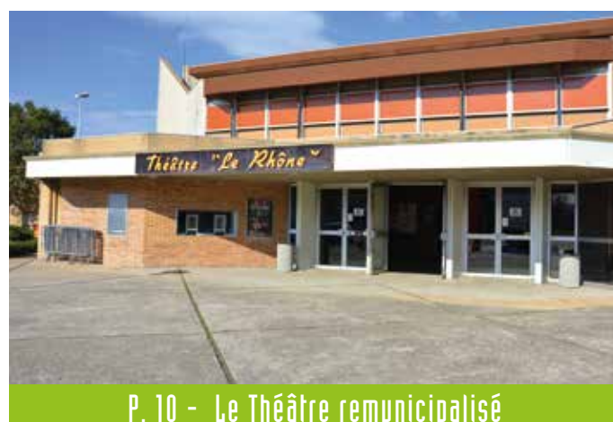
P. 10 - Le Théâtre remunicipalisé