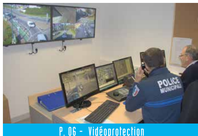
P. 06 - Vidéoprotection

en savoir plus sur www.bourg-les-valence.fr