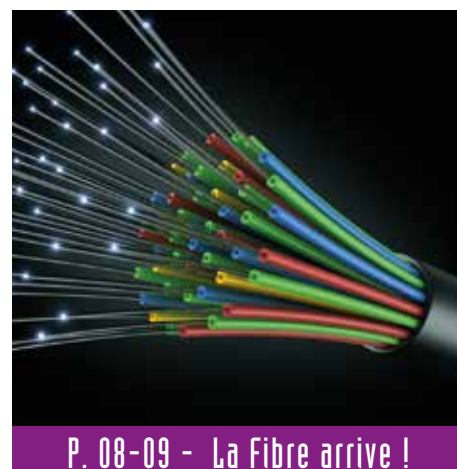
P. 08-09 - La Fibre arrive !