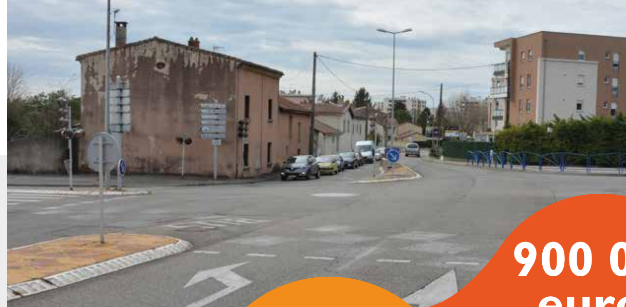
Le carrefour du Moulin d'Albon

Ce résultat a pu être obtenu grâce aux économies réalisées sur les dépenses courantes de fonctionnement (dépenses de personnel, consommation d'eau, frais de transports, fournitures, dépenses d'énergie...). Celles-ci diminueront de 2,1 millions d'euros en 2016.