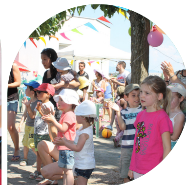
6 juin Plus de 1000 personnes se sont déplacées à la Fête du jeu au Centre Louis Jourdan