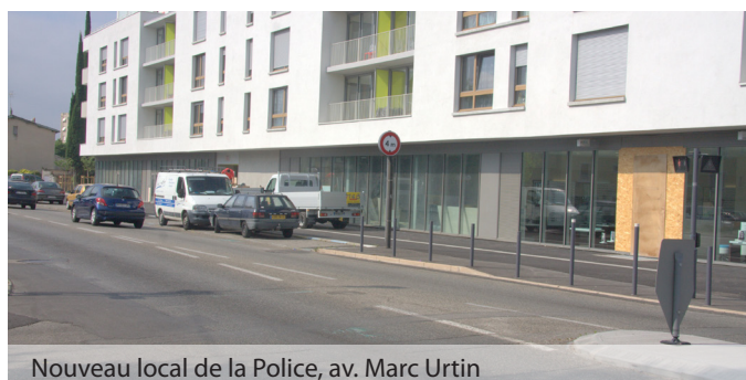
Nouveau local de la Police, av. Marc Urtin